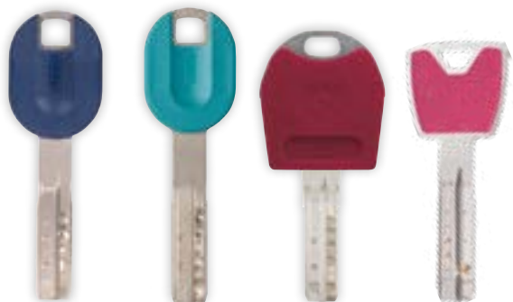
PRO CAP PLUS

Unsere Schlüsselkappen bieten Ihnen eine große Farbvielfalt zur Unterstreichung Ihrer Individualität. Wählen Sie aus verschiedenen Kappenformen und Designfarben Ihre Schlüsselkappe aus. Da ist sicher für jedes Familienmitglied die passende Farbe dabei. Dank der Farbkennzeichnung lassen sich die Schlüssel auf den ersten Blick unterscheiden. Damit hat die ständige Suche nach dem richtigen Schlüssel am Schlüsselbrett ein Ende. Zusätzlich können Sie mit unserer Pro Cap Plus und Skuni Cap Ihr mechanisches Schließsystem mit einem Transponder ausstatten. So können Sie mechanische und elektronische Zylinder mit nur einem Schlüssel bedienen oder Alarmanlagen sowie weitere Fremdsysteme ansteuern.