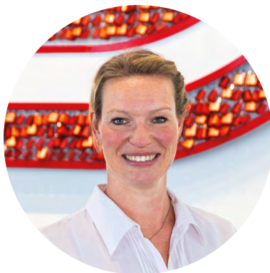
KATHRIN EHLER PM Digitales Lernen